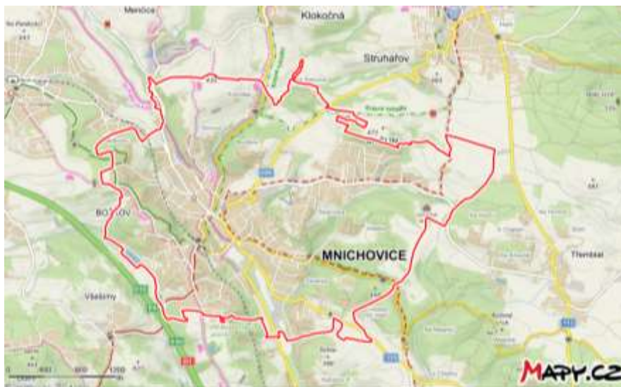
Mapa města Mnichovice, zdroj: Mapy.cz, 2021.

Město Mnichovice a jeho 3 950 obyvatel obsluhují 3 autobusové (489, 490 a 495) a 2 železniční linky (S9 a R49). Město má 3 místní části: Božkov (cca 700 obyvatel), Mnichovice (cca 3000 obyvatel) a Myšlín (cca 250 obyvatel). Váha významnosti linek je nejprve rozdělena podle počtu obyvatel v místních částech: Božkov 0,18; Mnichovice 0,76 a Myšlín 0,06.