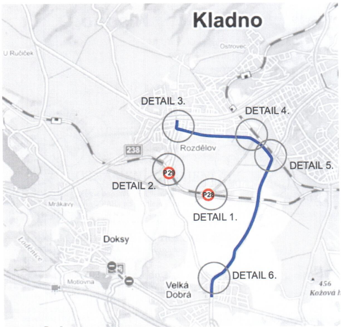
DETAIL KŘÍŽOVATEK S DZ Přejezd P 28 - 3. - 18.5.2021