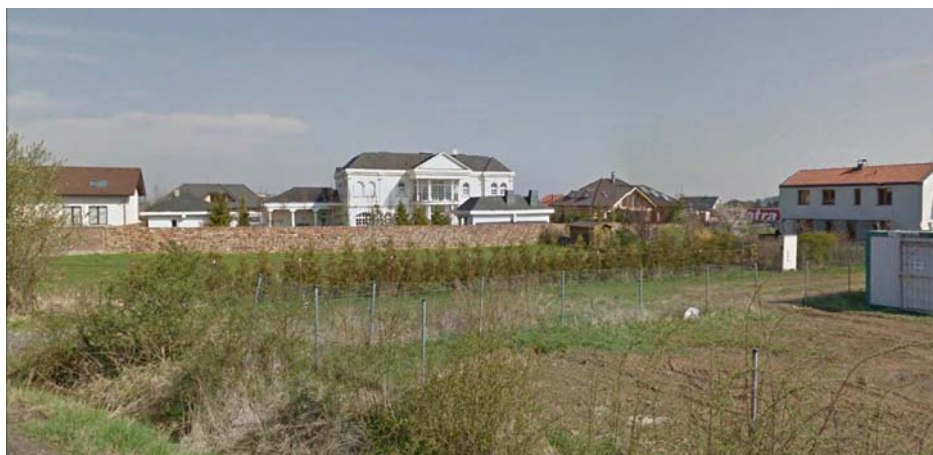
příklad výstavby bez regulace architektonických podmínek

plochy, výška zástavby, počet nadzemních a podzemních podlaží, typ střechy) a v neposlední řadě architektonické podmínky (architektonický výraz stavby). V Regulačním plánu jsou popsány architektonické podmínky zajišťující jednotný výraz stavby (volbou použitých přírodních materiálů, volbou použitých barevných odstínů na fasádách objektů a zařazením mezi architektonické styly/výrazy – minimalismus a organická architektura). Architektonický výraz stavby považuje regulační plán při rozhodování v území za zásadní, díky jasně definovaným podmínkám se Regulační plán snaží předejít nestejnorodému, roztržitěnému architektonickému řešení jednotlivých objektů.