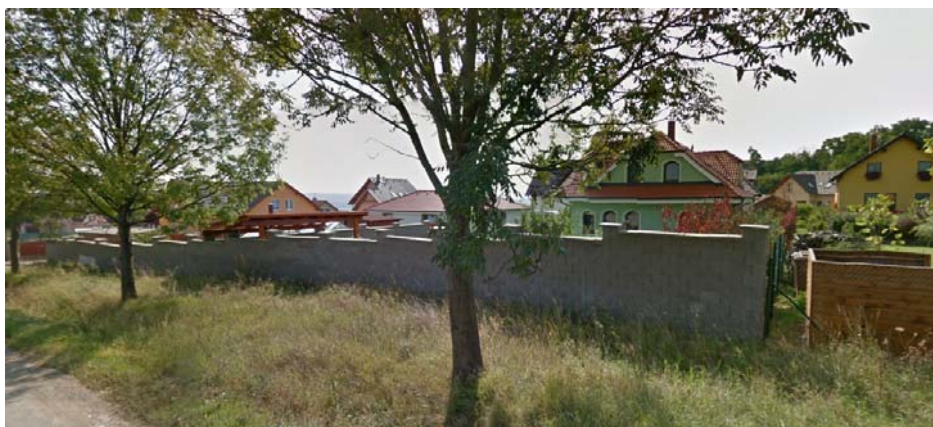
příklad výstavby bez regulace architektonických podmínek

Regulační plán se při definici podmínek regulace zaměřil zejména na individuální výstavbu v rodinných domech (popř. dvojdomech), kde se předpokládá větší riziko nestejnorodému, roztržitěnému architektonickému řešení jednotlivých objektů. Benevolentnější jsou podmínky v případě staveb pro bydlení v bytových domech a staveb občanského vybavení, u kterých regulační plán předpokládá jednoho majitele/stavebníka areálu.