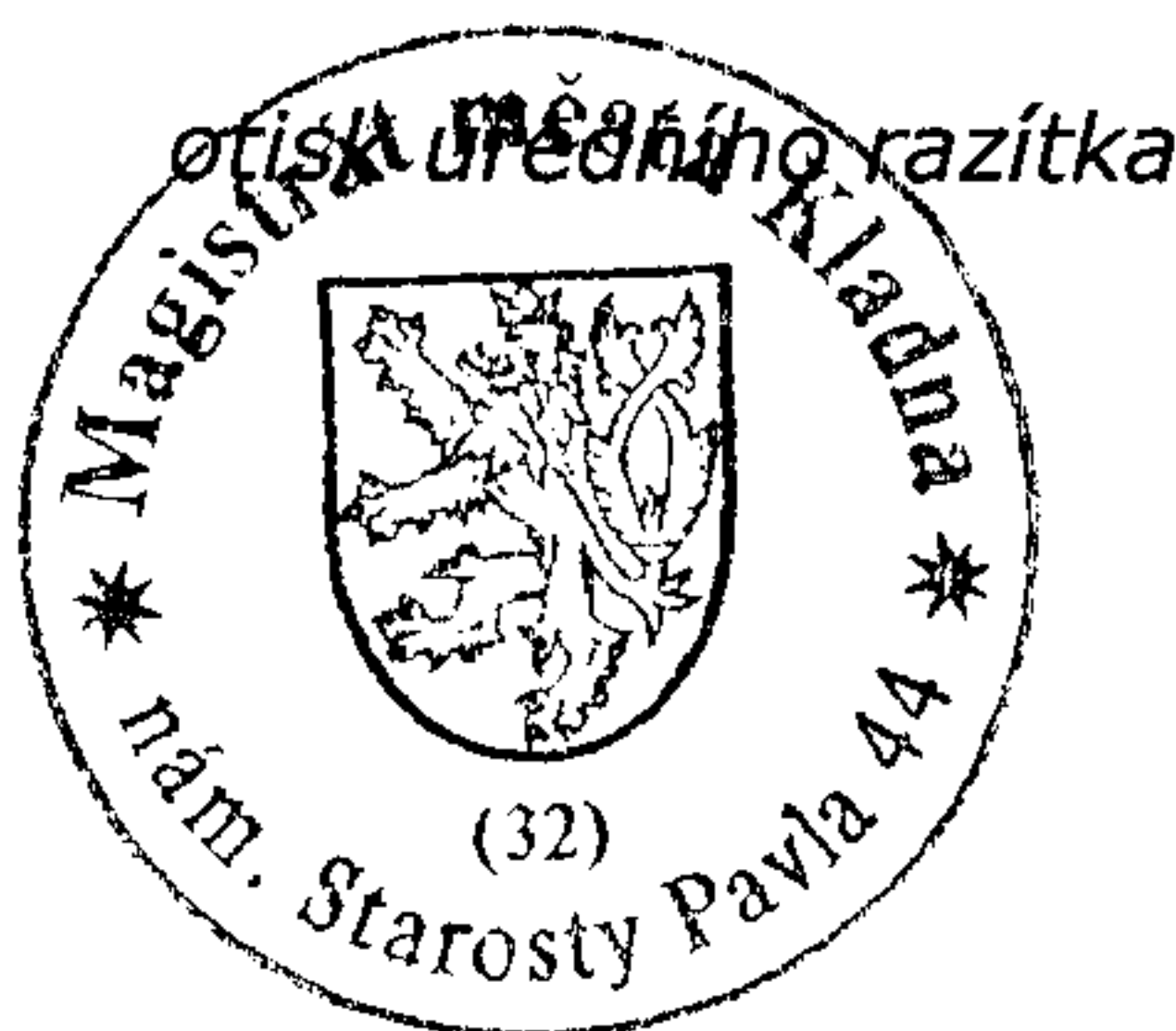
Ing. Kateřina Kohlíčková oprávněná úřední osoba

Proti tomuto rozhodnutí může účastník řízení podat podle ustanovení § 83 odst. 1 správního řádu odvolání, ve kterém se uvede v jakém rozsahu se rozhodnutí napadá a dále namítaný rozpor s právními předpisy nebo nesprávnost rozhodnutí nebo řízení, jež mu předcházelo, ve lhůtě 15 dnů ode dne jeho oznámení ke Krajskému úřadu Středočeského kraje se sídlem Zborovská 11, Praha 5 podáním učiněným u Magistrátu města Kladna, odboru životního prostředí. Odvolání se podává v počtu 2 stejnopisů. Nepodá-li účastník potřebný počet stejnopisů, vyhotoví je na jeho náklady Magistrát města Kladna. Podané odvolání má v souladu s ustanovením § 85 odst. 1 správního řádu odkladný účinek. Odvolání jen proti odůvodnění je nepřipustné.